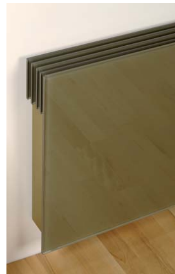
montáž radiátoru na zeď v interiéru